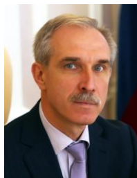
С.И. Морозов Губернатор Ульяновской области