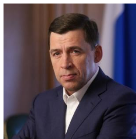
Е.В. Куйвашев Губернатор Свердловской области