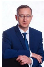
В.В. Шапша Врио губернатора Калужской области