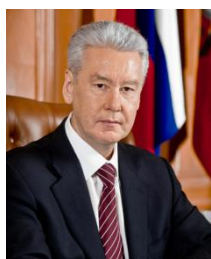
С.С. Собянин Мэр г. Москвы