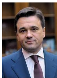
А.Ю. Воробьев Губернатор Московской области