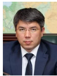
А.С. Цыденов Глава Республики Бурятия