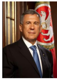
Р.Н. Минниханов Президент Республики Татарстан